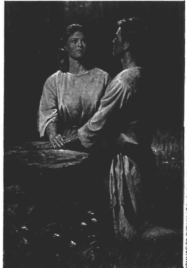
ADAM UND EVA KNIEN AM ALTAR, VON DEL PARSON

konfrontiert werden, die ein solches Verhalten beziehungsweise solche Gefühle im religiösen, seelischen und familiären Bereich auslösen? Was sagt man einem jungen Menschen, der gesteht, daß er sich zu jemandem seines Geschlechts hingezogen fühlt oder daß er in jemanden verliebt ist, der demselben Geschlecht angehört? Wie sollen wir reagieren, wenn jemand offenlegt, daß er homosexuell beziehungsweise