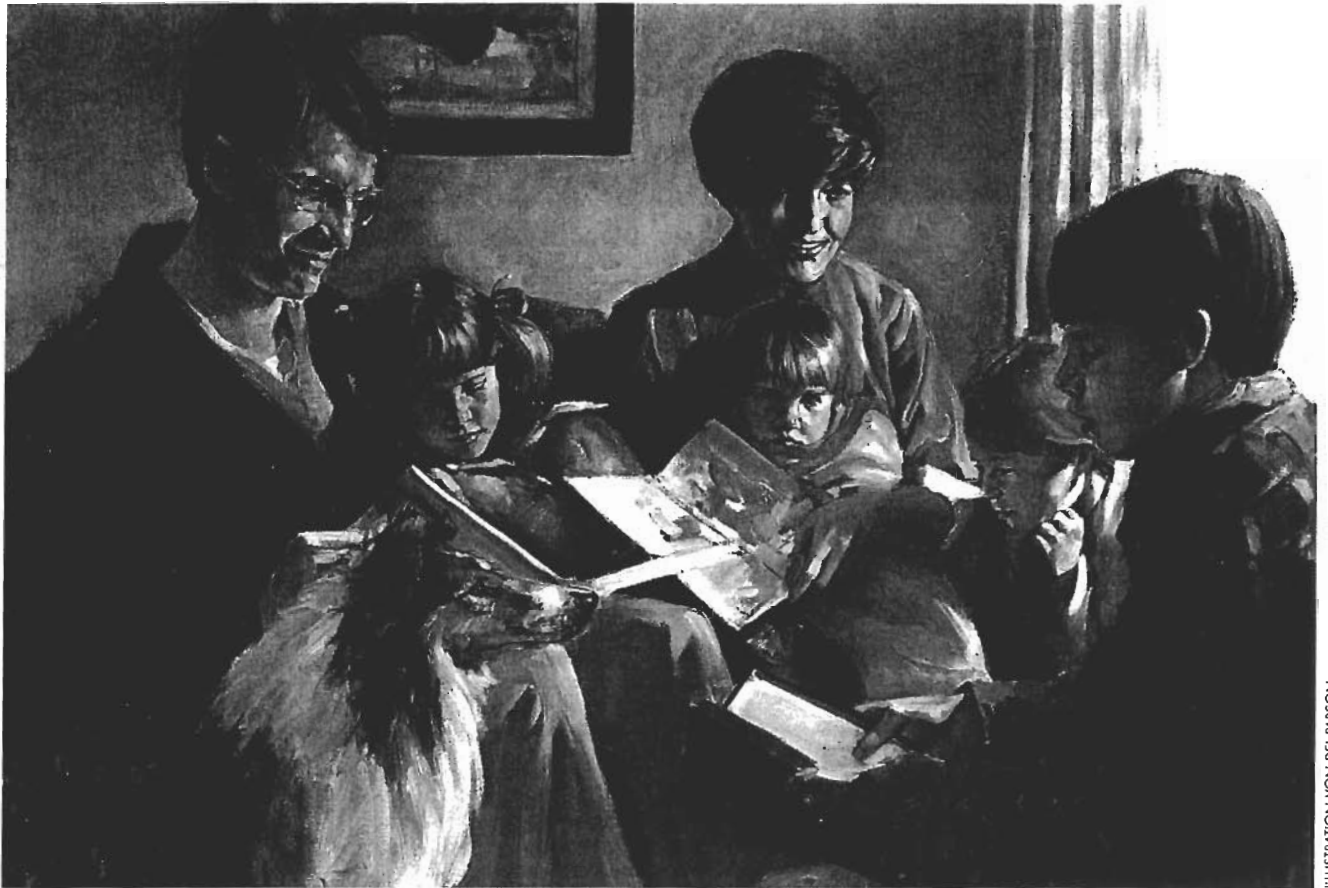
ILLUSTRATION VON DEL PARSON

liebepoll um ihn bemühen. Die Erste Präsidentschaft hat uns das in dem oben erwähnten Brief vom 14. November 1991 gezeigt. Nach dem oben erwähnten Zitat, dem zufolge Unzucht, Ehebruch und homosexuelles und lesbisches Verhalten Sünde sind, heißt es nämlich weiter: