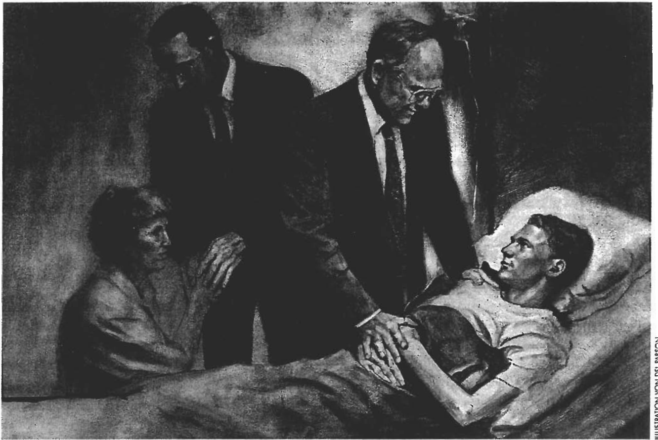
ILLUSTRATION VON DER PARSON

Körper vernichten, indem sie den ewigen Tod wählen, „gemäß dem Wollen des Fleisches, ... wodurch der Geist des Teufels die Macht erlangt, euch gefangenzunehmen und in die Hölle hinabzuführen, damit er in seinem eigenen Reich über euch regieren könne“ (2 Nephi 2:29).